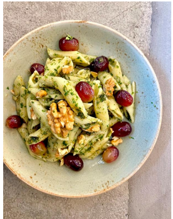
Penne mit glasierten Trauben