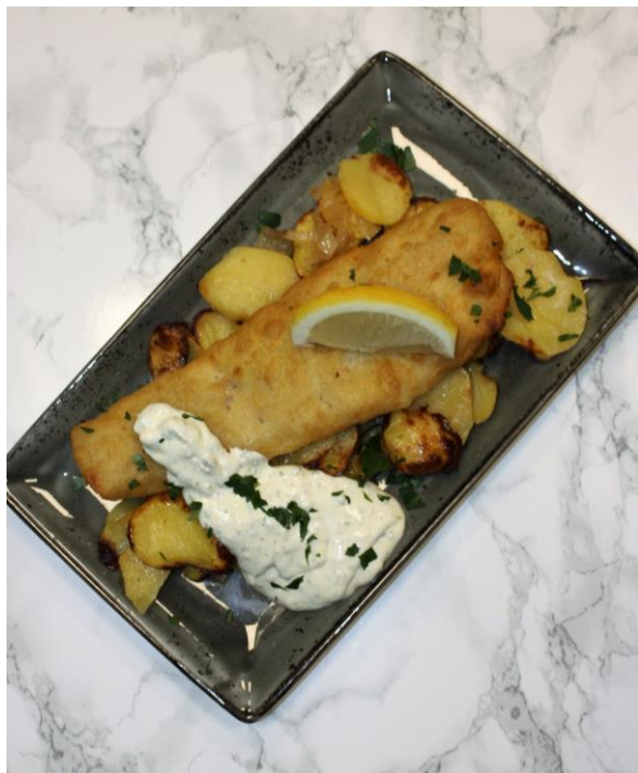
Backfisch auf Bratkartoffeln