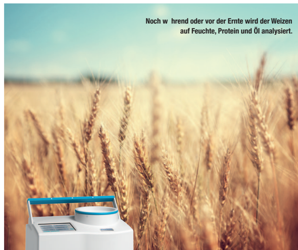
Noch während der Ernte wird der Weizen auf Feuchte, Protein und Öl analysiert.

Ein gutes Beispiel sind die neuen tragbaren Ganzkornmessgeräte Inframatic, die der Landwirt mit auf das Feld neh-