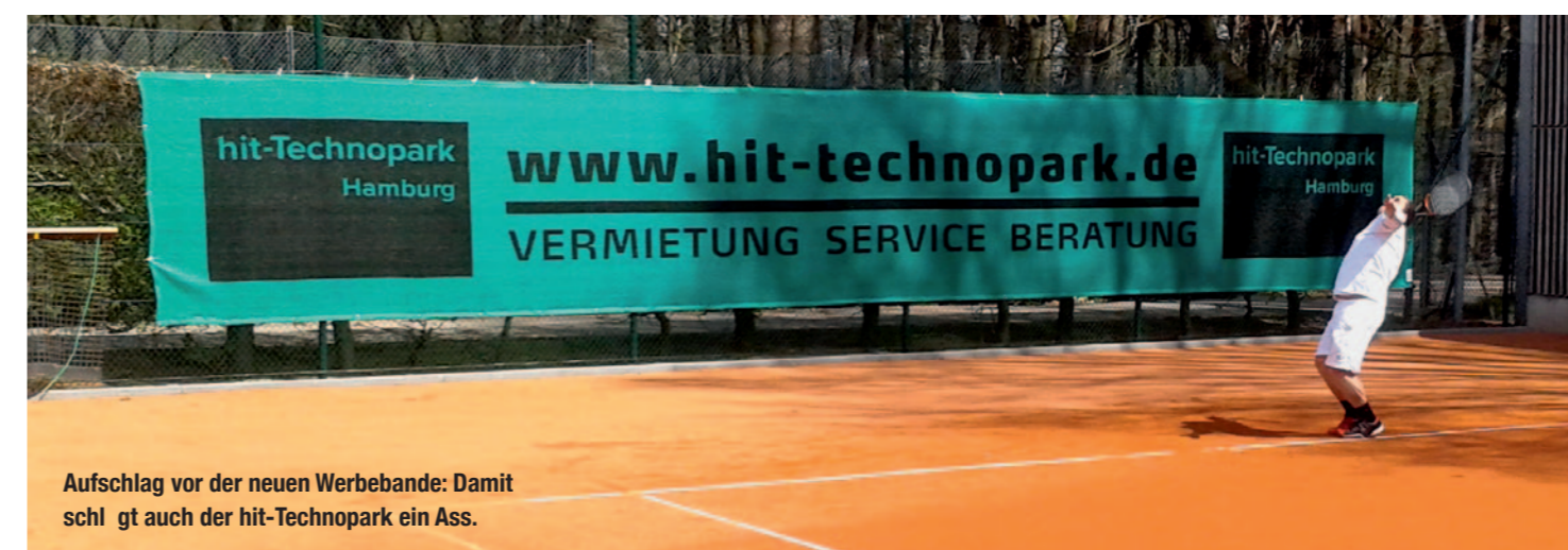
Aufschlag vor der neuen Werbebande: Damit schlägt auch der hit-Technopark ein Ass.

Wer in diesen Tagen auf den Tennisplätzen des Harburger Turnerbundes am Vahrenwinkelweg seine Medenspiele bestreitet, entdeckt am Kopfende von Platz 1 die neue Werbebande des hit-Technopark. Erstmals wird bei den Tennisspielern des HTB für Hamburgs größten Technologiepark geworben. Es gibt aber noch einen zweiten, eher privaten Grund für das neue Engagement: Mehrere Mitarbeiterinnen im Team von hit-Service sind begeisterte und erfolgreiche Tennis-Spielerinnen.