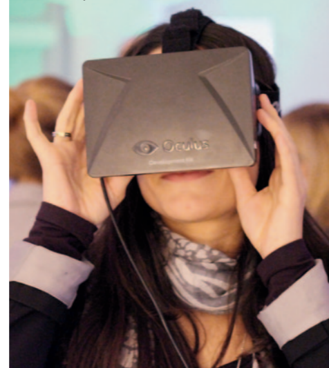
Attraktion 1: Fliegen mit einer Drone voller bewachungskameras.

Attraktion 2: Das Oculus Rift mit riesigem Sichtfeld, für das Facebook 400.000 Dollar in bar und 1,6 Milliarden in Aktien bezahlte.