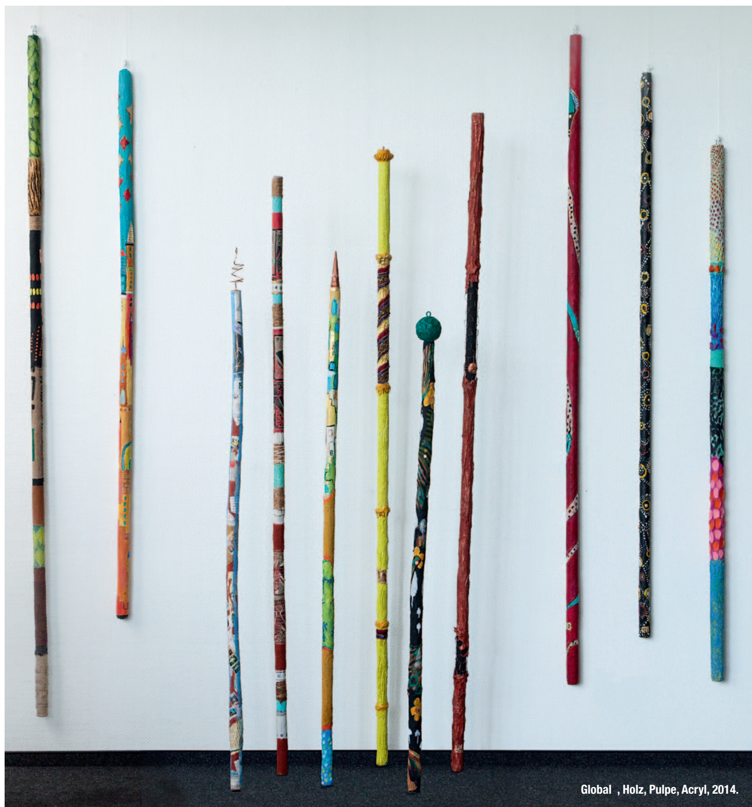
Global , Holz, Pulpe, Acryl, 2014.