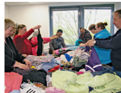
Die Kleidung wird von den Mitarbeitern der Kleiderkammer nach Qualität sortiert.

Die Kleiderkammer und Passage leisten Sozialarbeit im Doppelpack: Benachteiligte Menschen, die auf dem ersten Arbeitsmarkt wenig Chancen haben, werden integriert, qualifiziert oder können auch Schulabschlüsse nachholen. Wer länge-