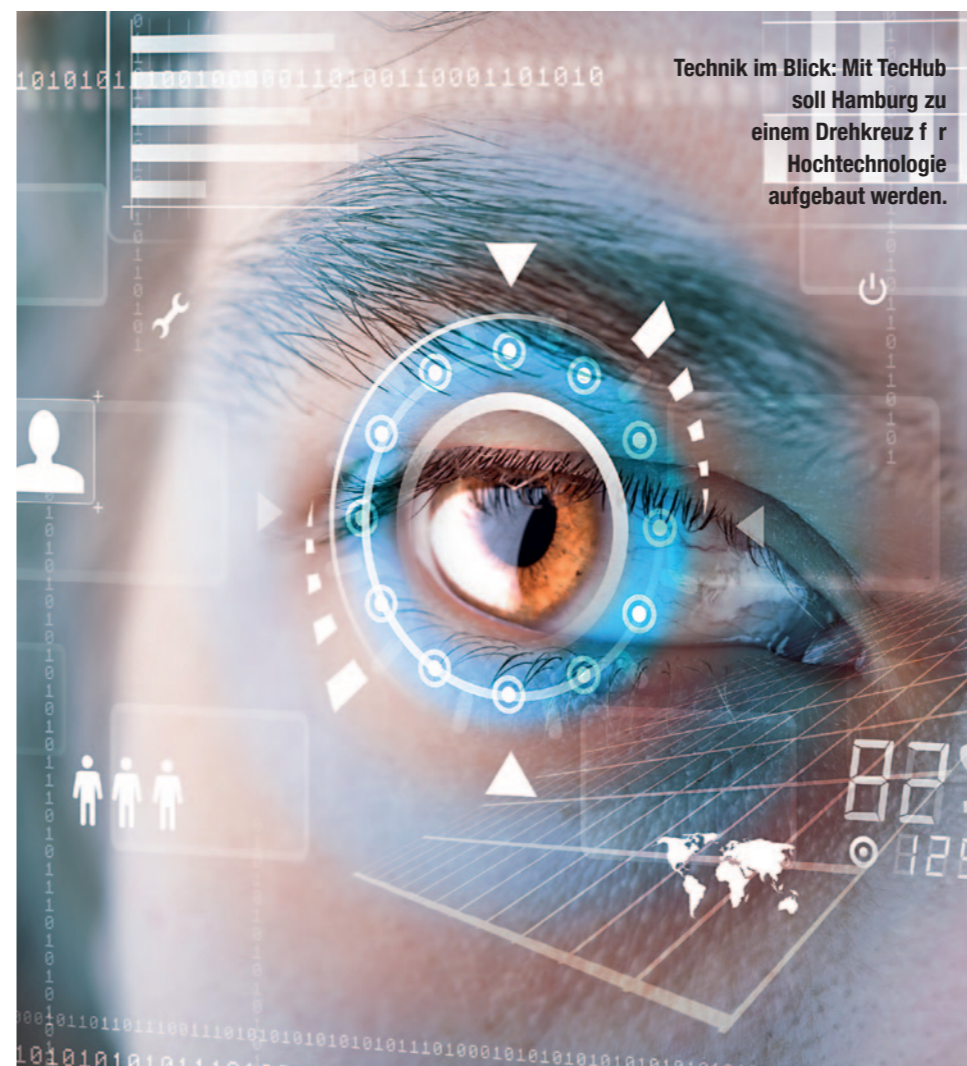
Technik im Blick: Mit TechHub soll Hamburg zu einem Drehkreuz für Hochtechnologie aufgebaut werden.