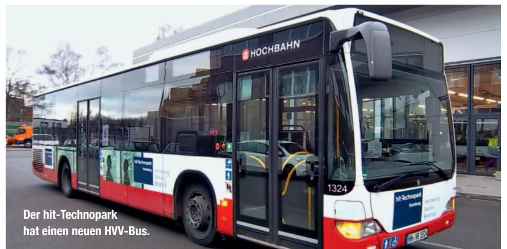
Der hit-Technopark hat einen neuen HVV-Bus.

für technologieorientierte Unternehmen durch die Straßen fahren. Dank der klaren Gestaltung mit weißer Schrift auf dunkelblauem Hintergrund sind die hit-Busse nun noch leichter von den anderen 776 Bussen im Hamburger Straßennetz zu unterscheiden – und der Werbeeffect noch größer.