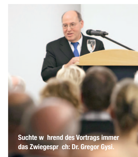
Suchte während des Vortrags immer das Zwiesgespräch: Dr. Gregor Gysi.

Während die Welt nicht mehr funktioniert, machten die Banken und Konzerne umso größere Geschäfte. „Sie sind mächtiger als die Politik“, sagte Gysi, was auch zu einer gigantischen Umverteilung der Vermögen geführt habe. „Nur ein Prozent der Menschen besitzen 99 Prozent des weltweiten Vermögens“, zitierte er aus einer aktuellen Studie, „und werden immer reicher.“