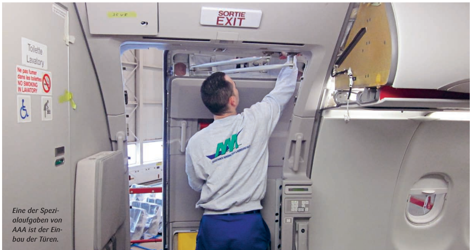
Eine der Spezialaufgaben von AAA ist der Einbau der Türen.

Das firmeneigene Projektmanagement ermöglicht eine komplette Abwicklung inkl. interner und externer Koordination, Planung und Überwachung sowie der Qualitätssicherung durch eigene Prüfer. Produzieren, liefern, Stempel. Der Kunde – und das sind Airbus, Zulieferer von Airbus und anderen Flugzeughersteller – muss sich um nichts mehr kümmern. Mit Airbus schloss AAA gerade einen Vertrag für Dienstleistungen am und im Flugzeug (Master Supply Agreement), der auch den Einbau von Testinstrumenten in die Flügel und sogar