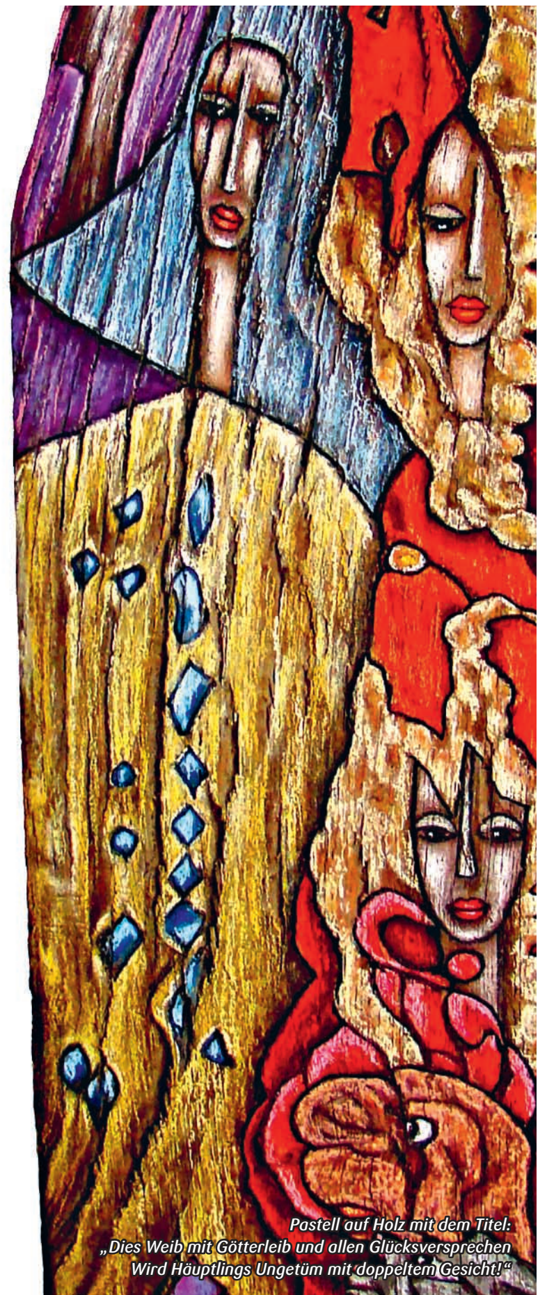
Pastell auf Holz mit dem Titel: „Dies Weib mit Götterleib und allen Glücksversprechen Wird Häuptlings Ungetüm mit doppeltem Gesicht!“