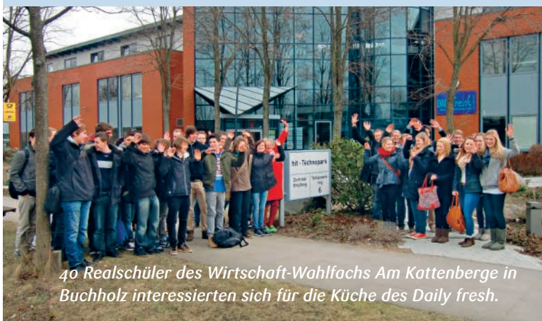
40 Realschüler des Wirtschaft-Wahlfachs Am Kattenberge in Buchholz interessierten sich für die Küche des Daily fresh.