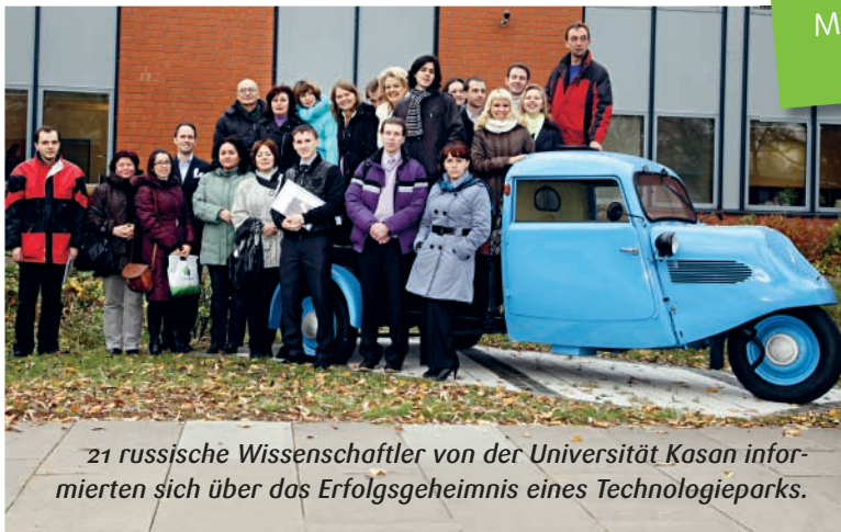
21 russische Wissenschaftler von der Universität Kasan informierten sich über das Erfolgsgeheimnis eines Technologieparks.