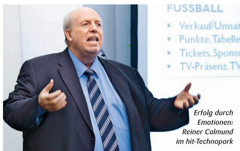
Erfolg durch Emotionen: Reiner Calmund im hit-Technopark

Denn der Top-Manager fordert Deutschlands Wirtschaftsführer und Unternehmer zu mehr Mut und einem klareren Bekenntnis zur Jugend auf. „80 Prozent aller Firmen werden erfolgreicher geführt, wenn die Älteren die Jüngeren ans Ruder lassen und ihnen Verantwortung übertragen“, sag-